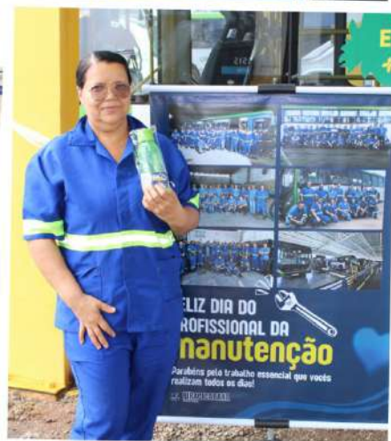
Dia do Profissional da Manutenção 20 de dezembro