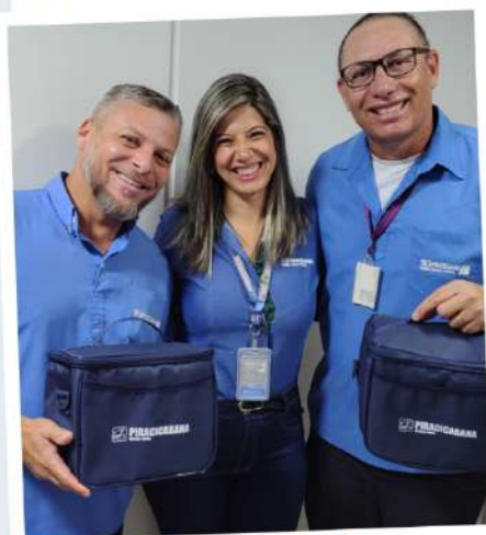
Dia do Motorista 25 de julho