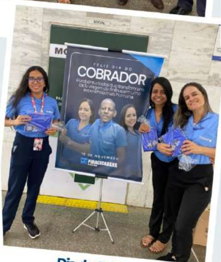
Dia do Cobrador 18 de novembro