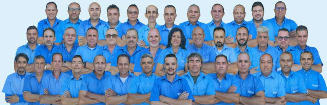
MOTORISTA NOTA 10 E ECODIESEL - CONHEÇA OS PREMIADOS DE JANEIRO DE 2024

Implantado em 100% da frota, o sistema de telemetria desempenha um papel fundamental no aprimoramento da qualidade de vida dos motoristas e da condução no trânsito. Ao aproximar o cartão funcional do leitor da telemetria, os dados da viagem são registrados em tempo real e podem ser acessados através do aplicativo MyMix, onde o motorista pode verificar os dados de aceleração, frenagem, consumo e outras informações que ajudam a melhorar a performance no volante.