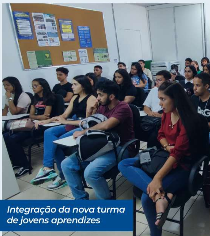
Integração da nova turma de jovens aprendizes

A Piracicabana DF possui 135 jovens aprendizes em seu quadro de funcionários, divididos entre os setores do Administrativo, Manutenção e Operação.