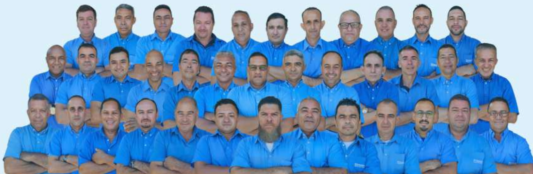
MOTORISTA NOTA 10 E ECODIESEL - CONHEÇA OS PREMIADOS DE NOVEMBRO DE 2023